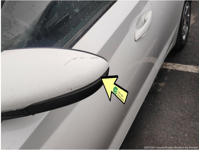
00070301 Carcasa Espejo retrovisor izq. Pintado