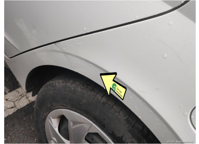
001601 Aleta trasera Izq.