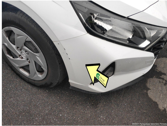
004501 Paragolpes delantero Pintado