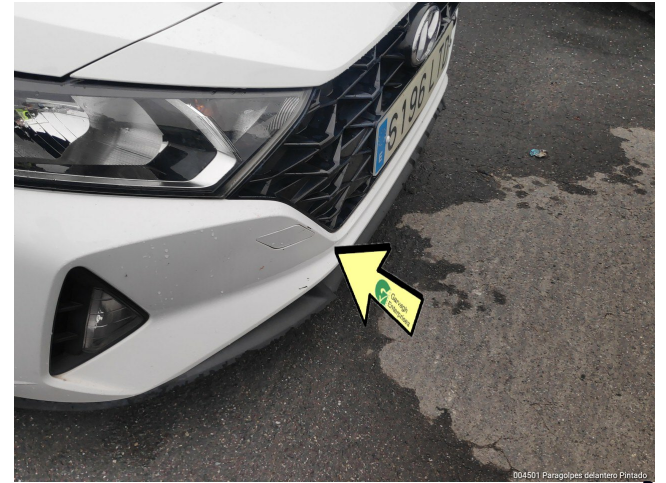
004901 Paragolpes delantero Pintado