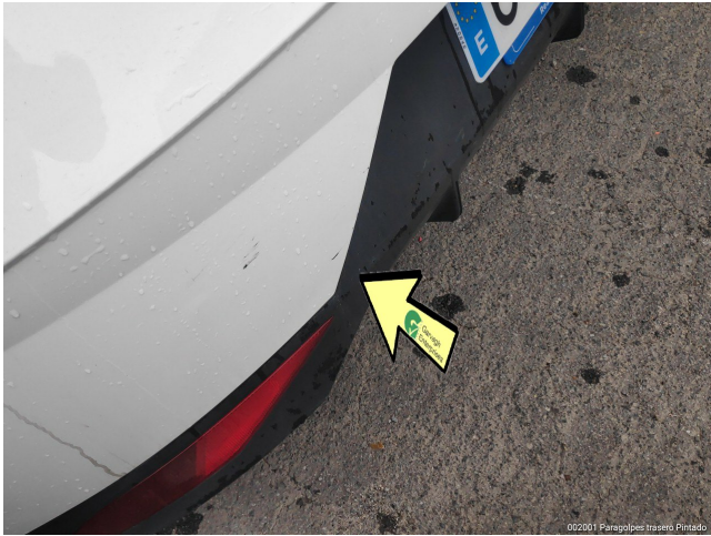
002001 Paragolpes trasero Pintado