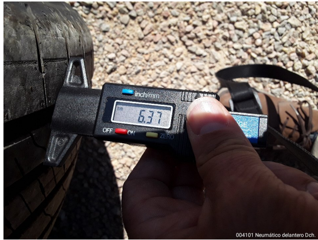
004101 Neumático delantero Dch.