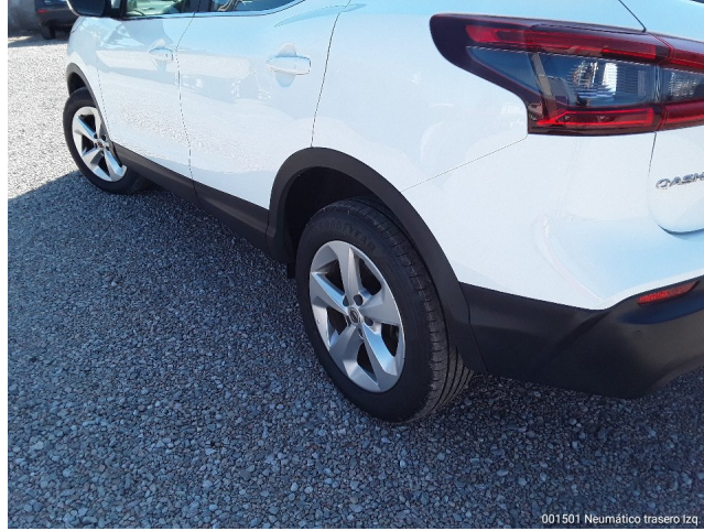
001501 Neumático trasero Izq.