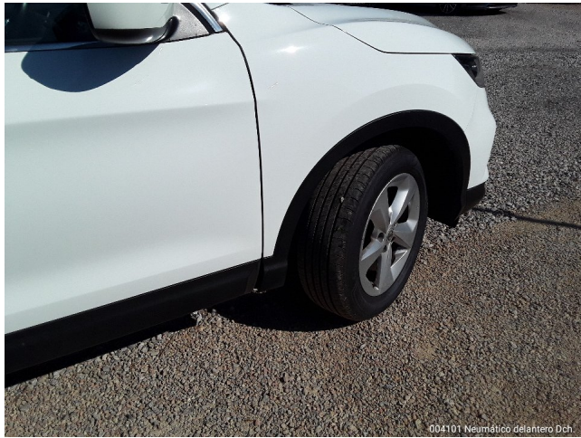
004101 Neumático delantero Dch.