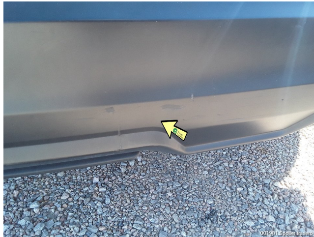
001501 Espalda Trasero