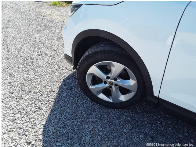
000601 Neumatico delantero Izq.