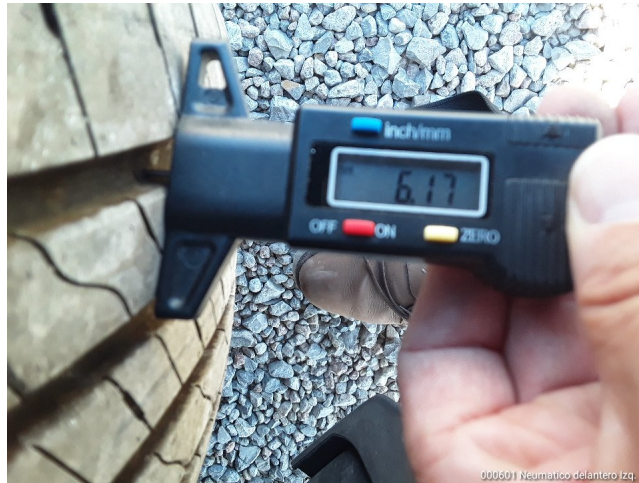
000601 Neumatico delantero Izq.