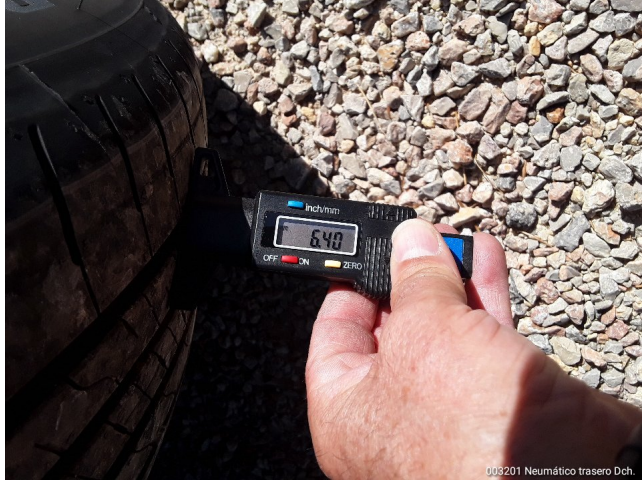
003201 Neumático trasero Dch.