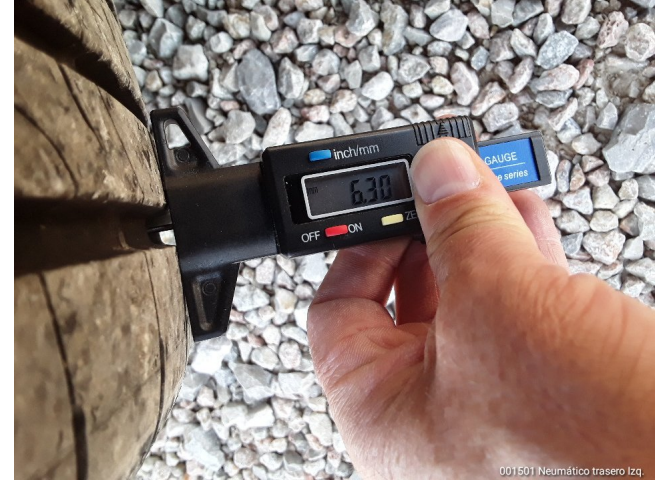
001501 Neumático trasero Izq.