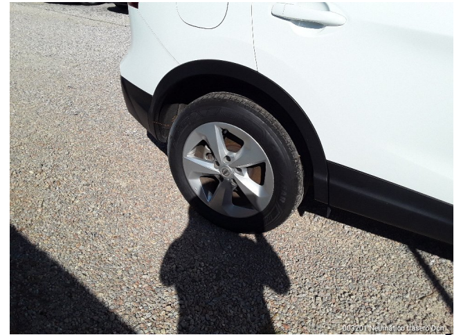
004102 Neumático trasero Dch.