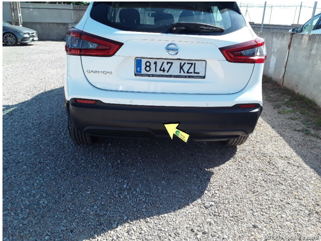
001501 Espalda Trasero