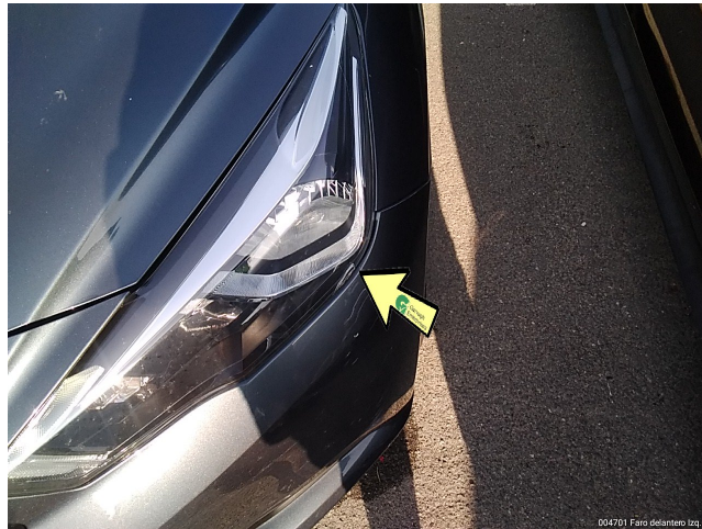
004701 Faro delantera izq