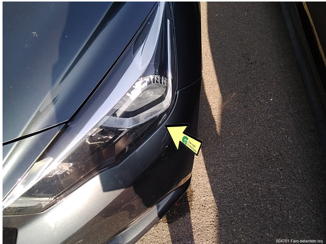
004701 Faro delantera izq