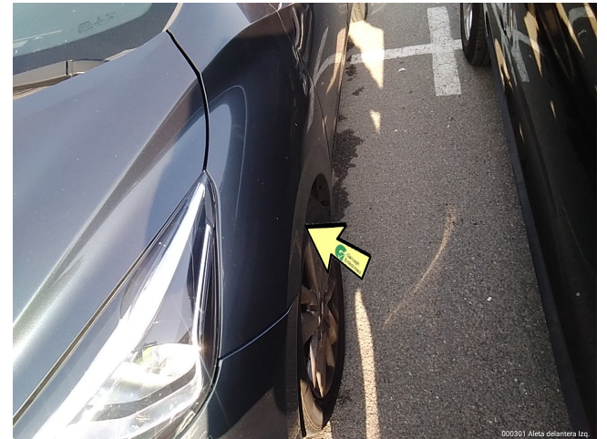
000301 Alerza delantera izq