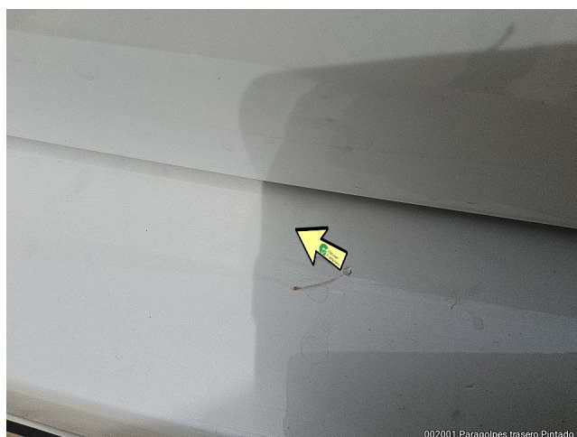
002001 Paragolpes trasero Pintado