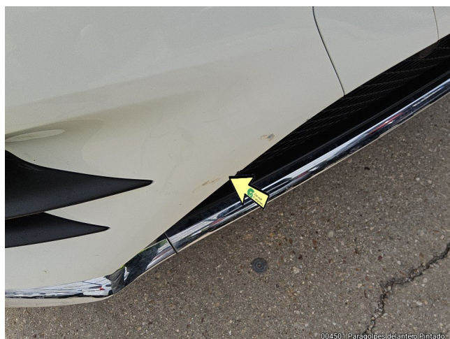
004501 Paragolpes delantero Pintado