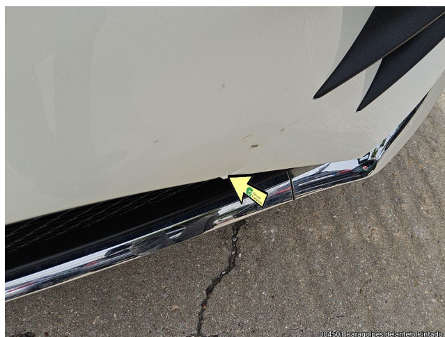
004501 Paragolpes delantero Pintado