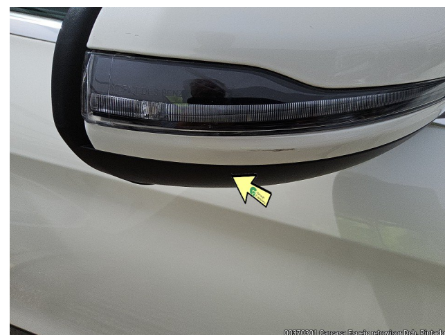
00370301 Carcasa Espejo retrovisor Dch. Pintado