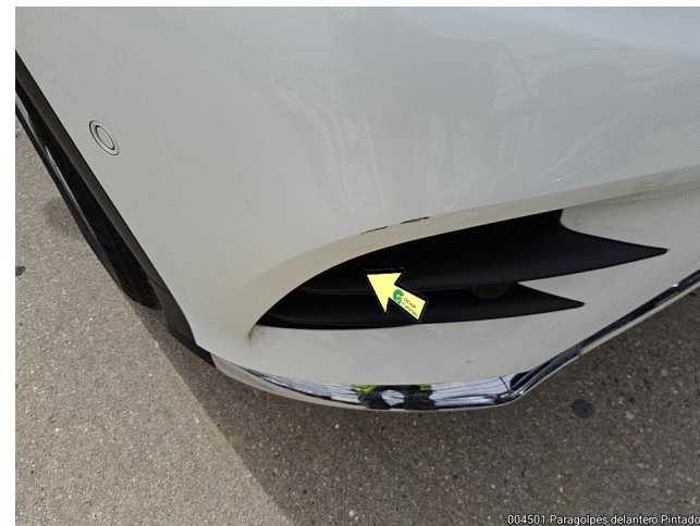
004501 Paragolpes delantero Pintado