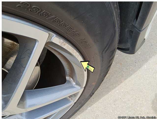
004001 Llanta Dk. Dch. Aluminio