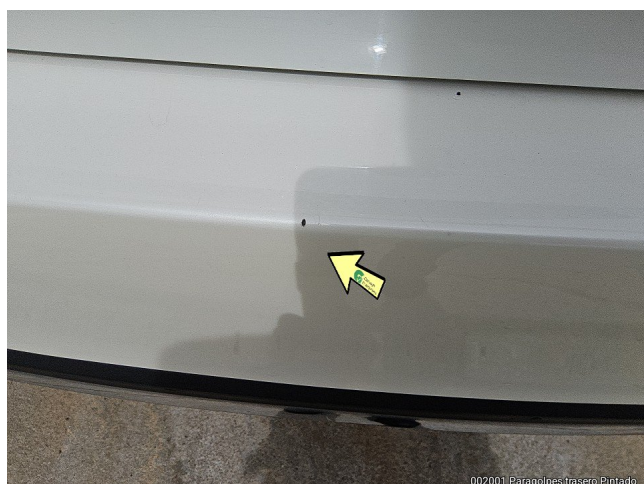
002001 Paragolpes trasero Pintado