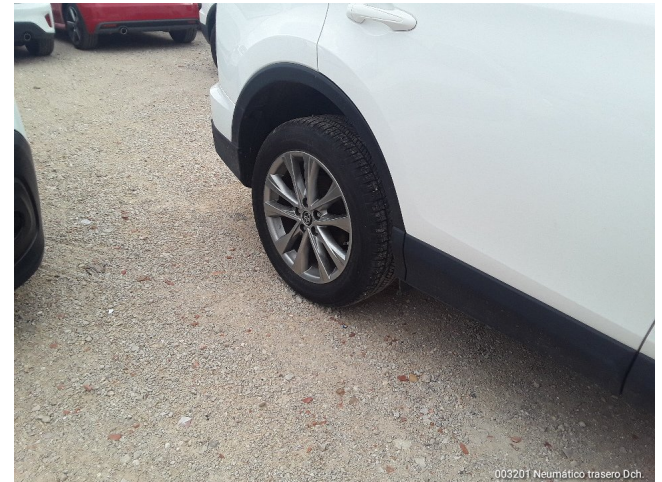
003201 Neumático trasero Dch.