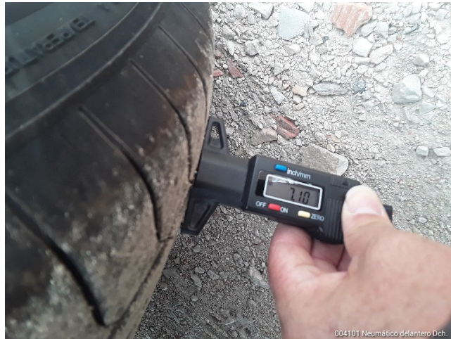
004101 Neumático delantero Dch.