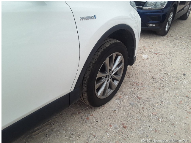
004101 Neumático delantero Dch.