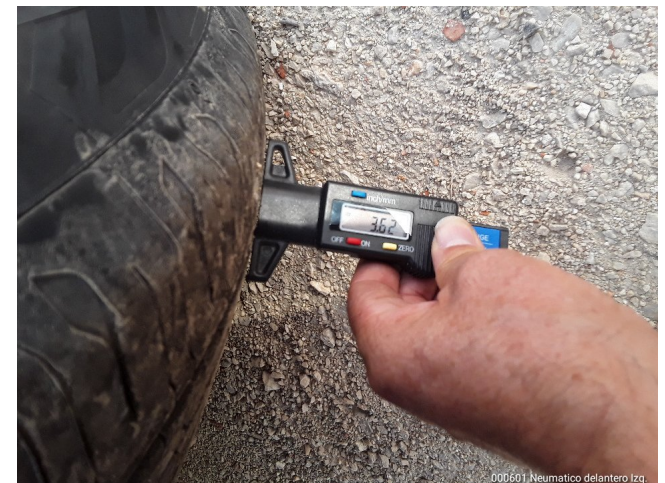
000601 Neumático delantero Izq.