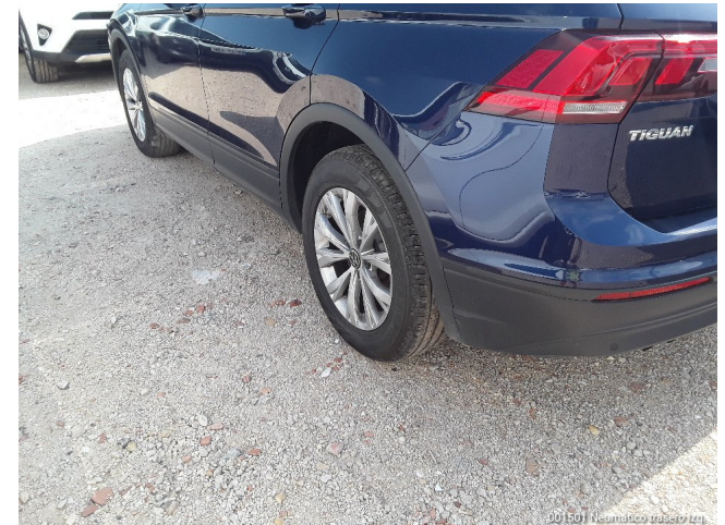
001501 Neumático trasero Izq.