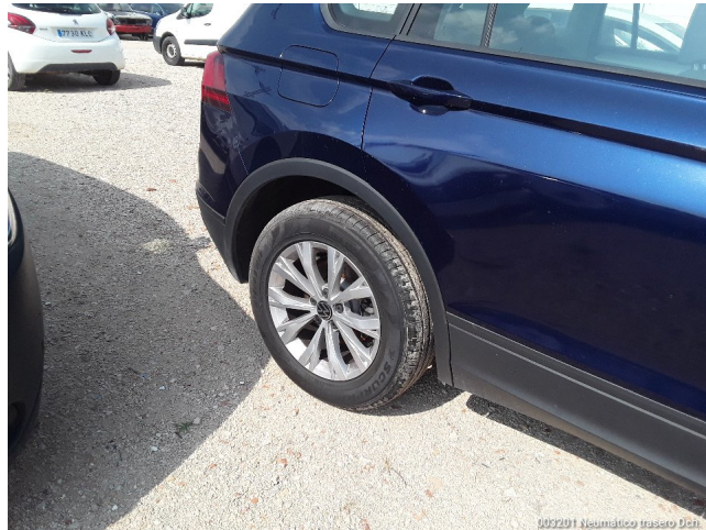
003201 Neumático trasero Dch.