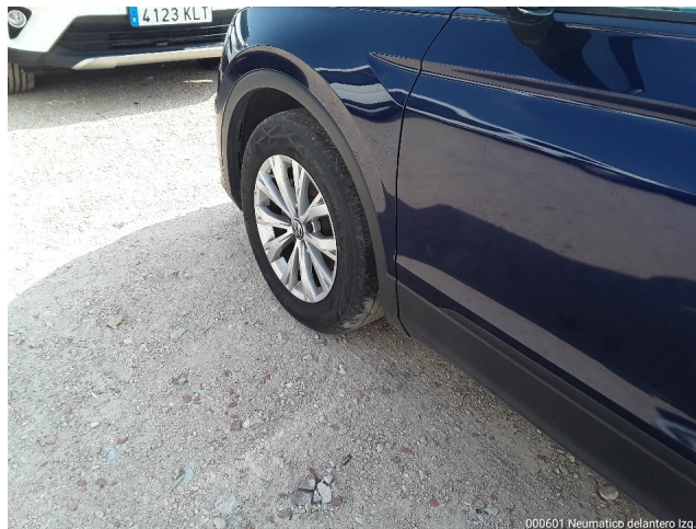
000601 Neumático delantero Izq.