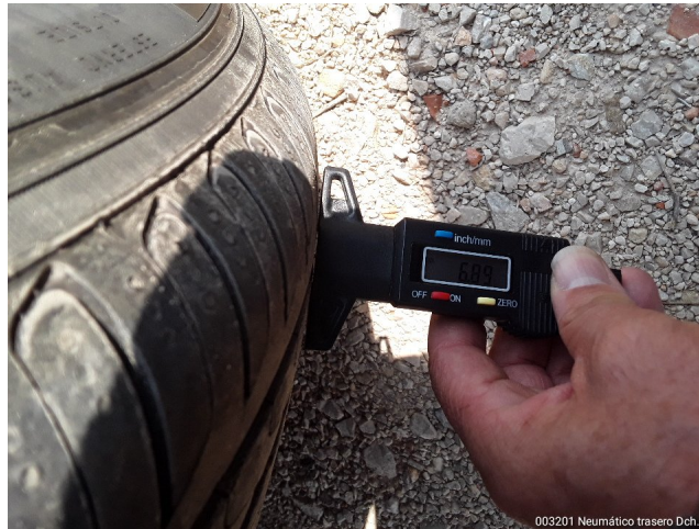
003201 Neumático trasero Dch.