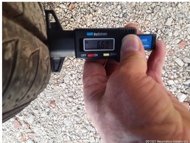
001501 Neumático trasero Izq.