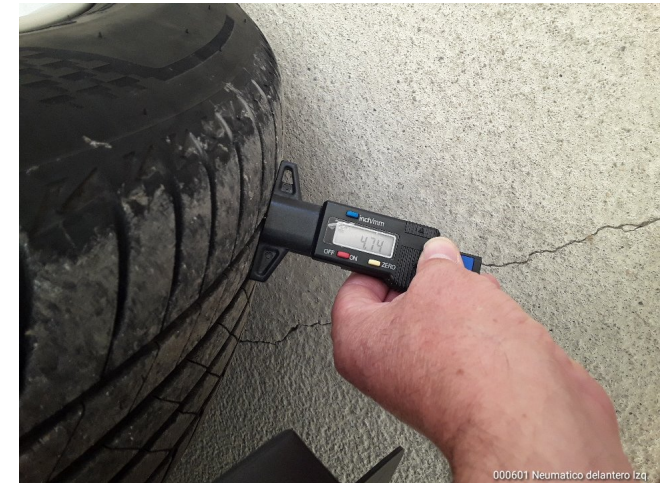
000601 Neumático delantero Izq