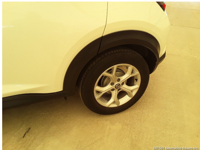
001501 Neumático trasero Izq