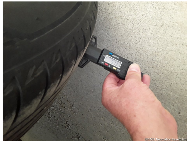
001501 Neumático trasero Izq