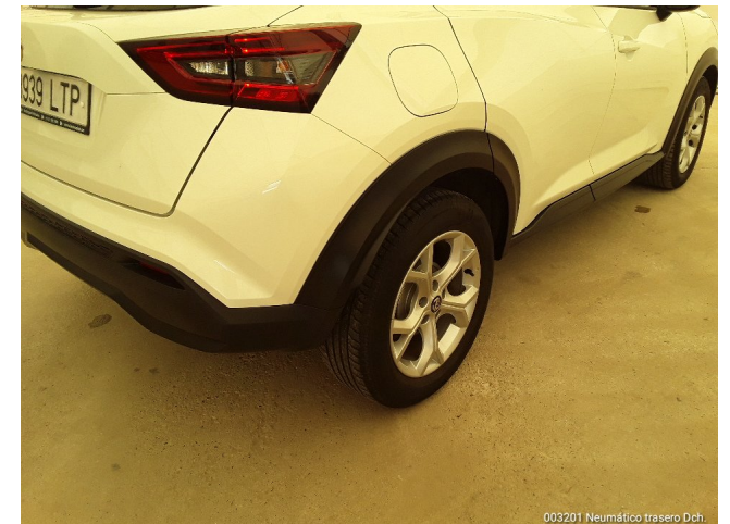
0003201 Neumático trasero Dch