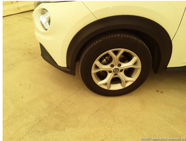
000601 Neumático delantero Izq

NISSAN e9*2007/46*6697 SJNFAAF16U1139549 1700 kg 2950 kg 1- 950 kg 2- 860 kg Type FAAF16 Colour, Trim 328 G Model FRNALTYP16UGA-GFVP