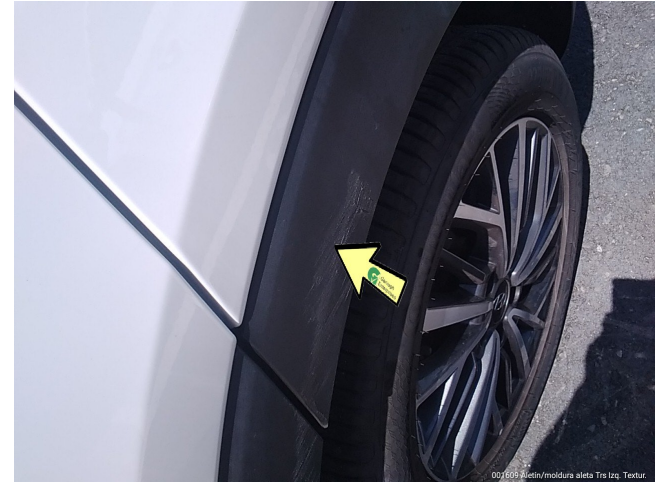
001600 Moldin/modura aleta Trs Izq. Textura