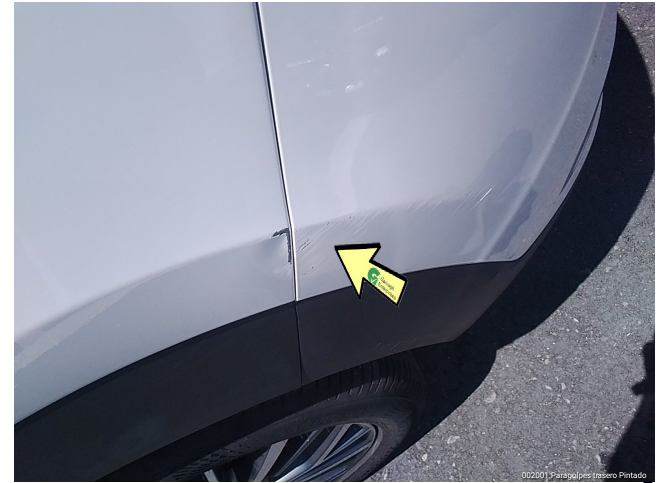
002201 Paragolpes trasero Pintado