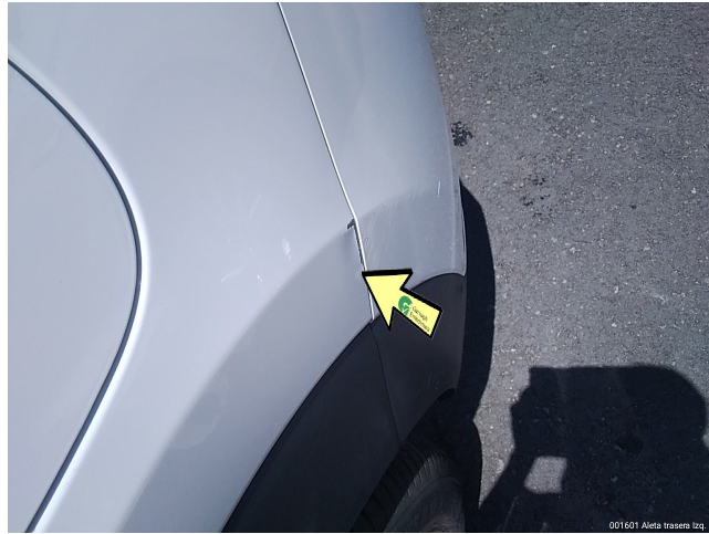
001601 Aleta trasera Izq.