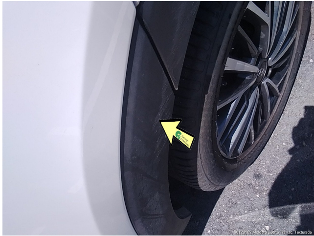
00120112 Moldura puerta Trs Izq. Texturada