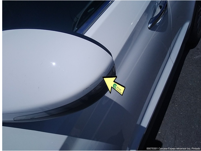
00070301 Carcasa Espejo retrovisor Izq. Pintado