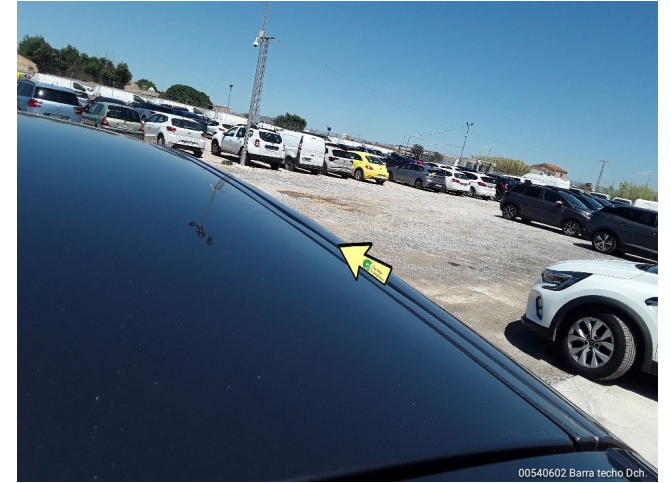
00540602 Barra techo Dch