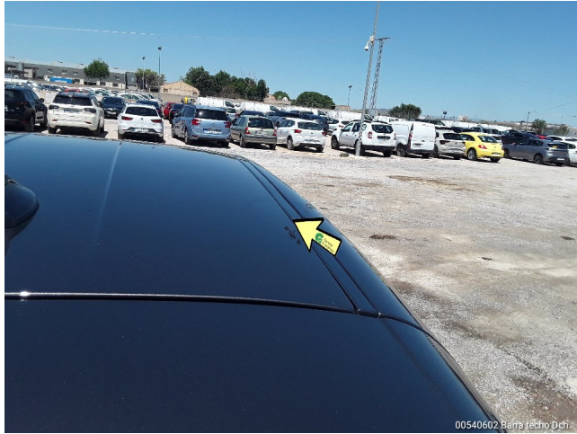
00540602 Barra techo Dcha