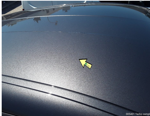
005401 Techo completo