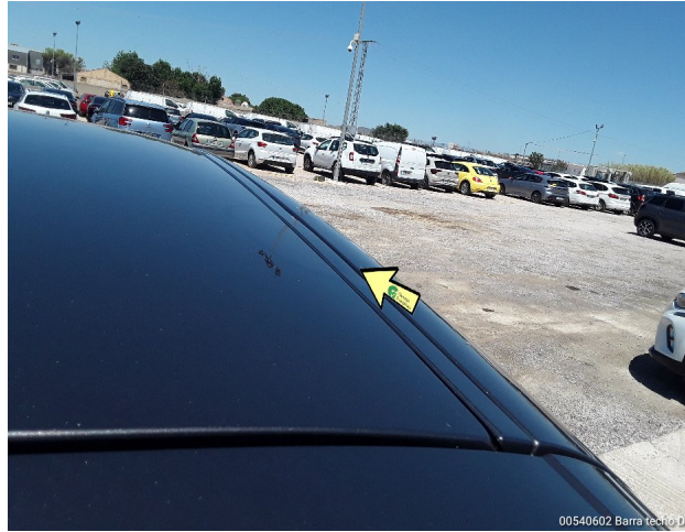
00540602 Barra techo Dcha