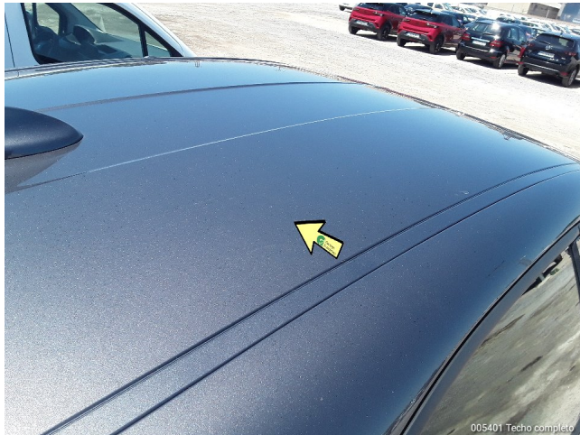
005401 Techo completo