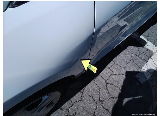
000301 Aleta delantera Izq