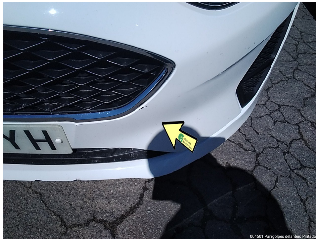
004501 Paragolpes delantero Pintado