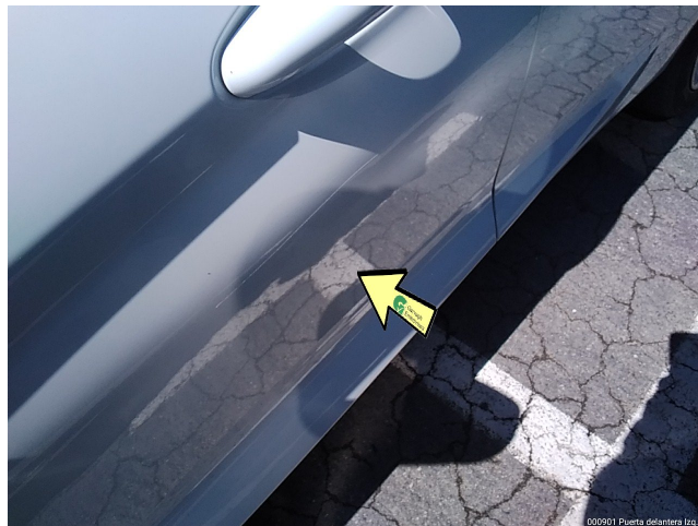
000901 Puerta delantera Izq