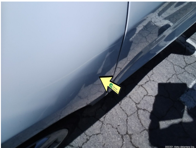
000301 Aleta delantera Izq