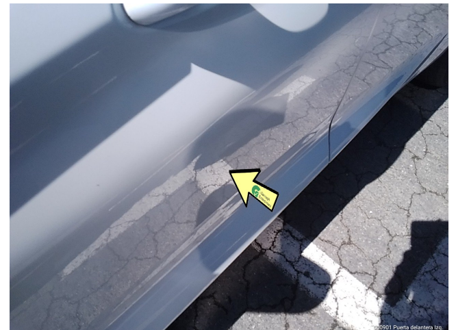
000901 Puerta delantera Izq