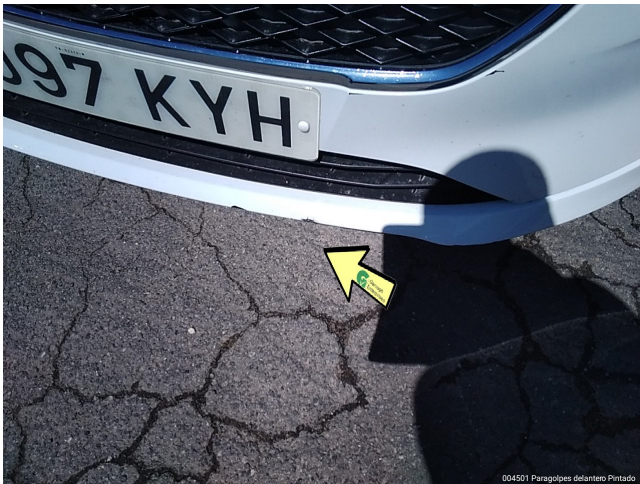
004501 Paragolpes delantero Pintado